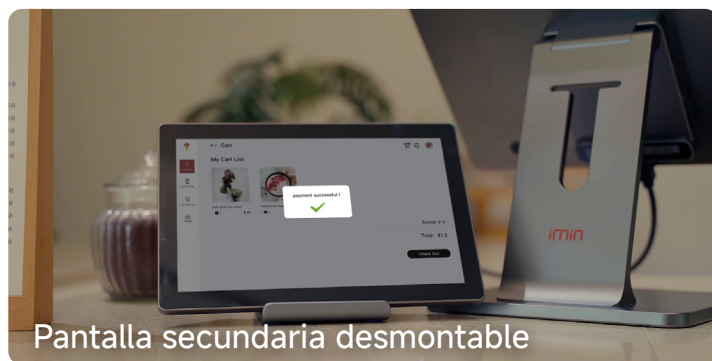
Pantalla secundaria desmontable