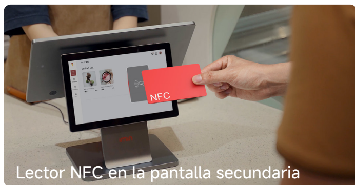
Lector NFC en la pantalla secundaria